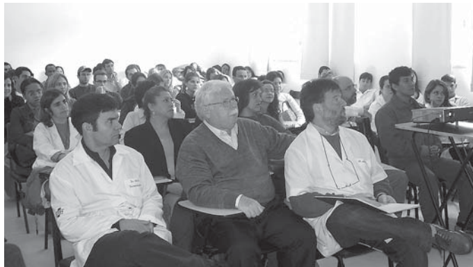
Público participante do primeiro colóquio sobre imunizações realizado pela Sociedade de Infectologia do Estado do Rio de Janeiro