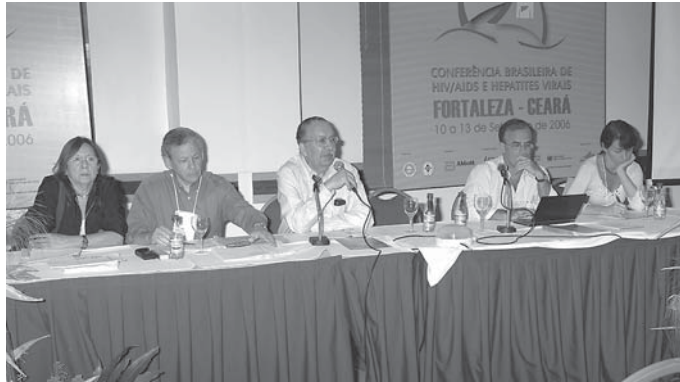
Membros da diretoria da SBI na reunião do Conselho Deliberativo, durante a 1ª Conferência Brasileira de HIV/Aids e Hepatites Virais

Outro item da pauta foi a escolha da sede para a II Conferência de HIV/Aids e Hepatites Virais, que acontecerá em 2008. As cidades de Uberlândia, em Minas Gerais, e da capital Brasília, no Distrito Federal, foram as candidatas e a escolha da plenária foi pela representante do Triângulo Mineiro. Foi decidido ainda que o evento deverá ser realizado no mês de setembro dos anos