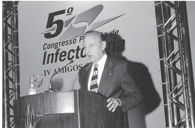
Na conferência de abertura, Robert Gallo abordou os mecanismos de ação do HIV e os avanços recentes em termos de terapias e vacinas

A programação do congresso contou com conferências e 12 me-