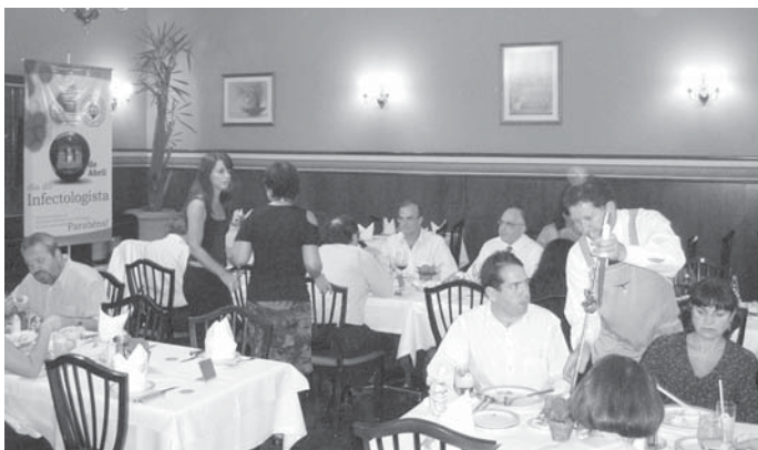
Jantar oferecido pela SBI em São Paulo reuniu cerca de 80 associados