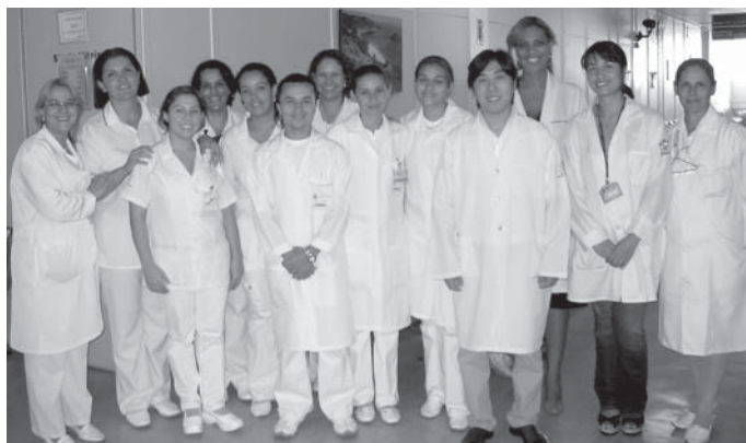
Equipe envolvida na campanha do Hospital Santa Marcelina, em SP