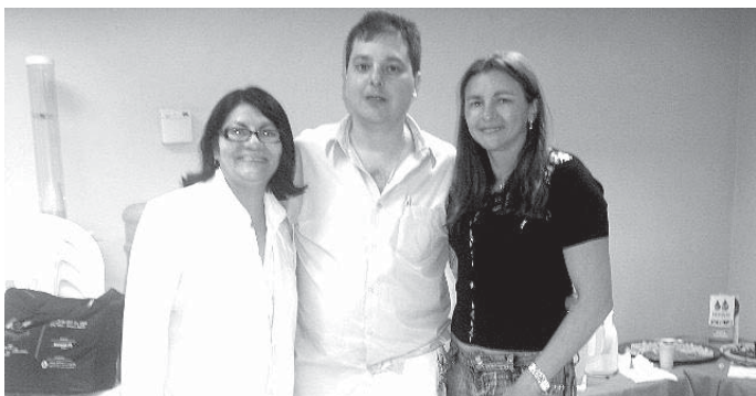
Na federada do PA, comemoração foi realizada com um "happy hour"