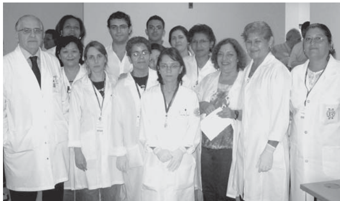
Médicos, enfermeiras e assistentes no mutirão do Emilio Ribas, em SP