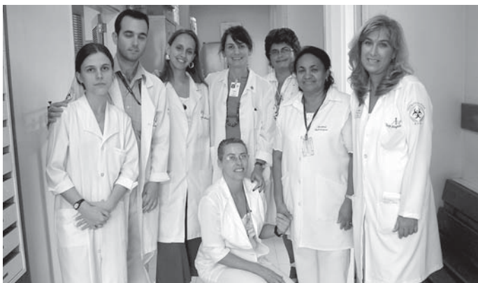
Profissionais que atuam no Hospital do Servidor Público Estadual de SP