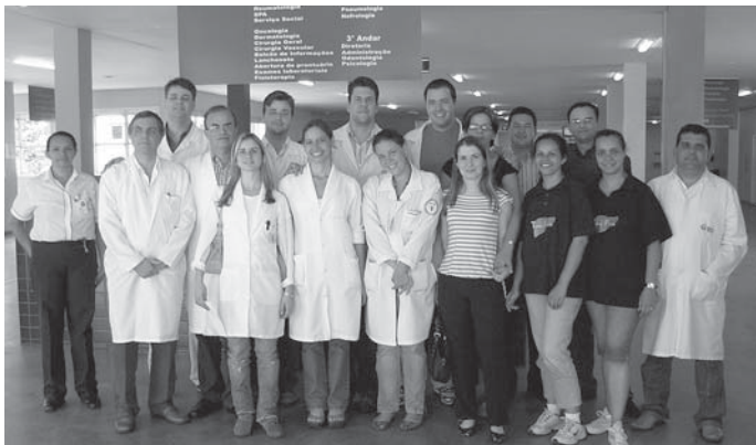
Equipe de profissionais no mutirão do hospital Heliópolis, em SP