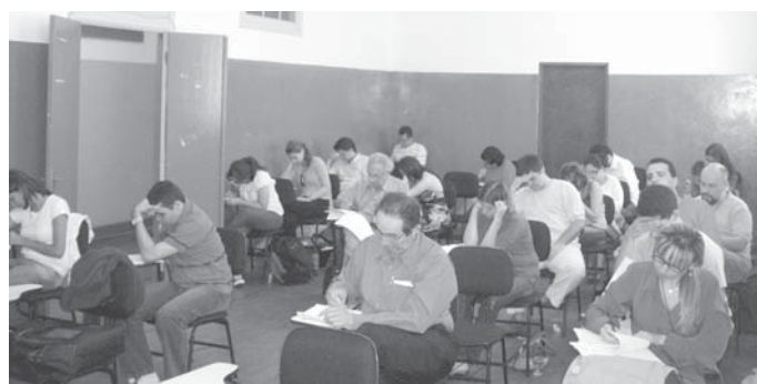
Prova ocorrida em Campos do Jordão teve participação de 22 candidatos

A SBI realizou um feito inédito este ano: promoveu um concurso de Título de Especialista em um congresso de uma outra sociedade de especialidade. A parceria foi realizada com a Sociedade Brasileira de Medicina Tropical, durante o primeiro dia do seu 43º congresso, realizado na cidade de Campos do Jordão/SP, entre 11 e 15 de março. Foram 22 os candidatos inscritos que participaram das provas. O resultado final, contendo a lista dos aprovados no concurso, será divulgado até o dia 11 de maio, por meio do site da instituição.