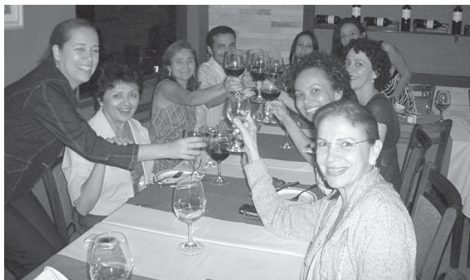
Sócios da federada do RN também tiveram jantar de confraternização