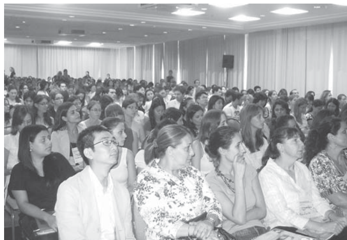
Auditório do III Simpósio de Infectologia do Paraná confirma o sucesso do evento

Médicos infectologistas e de clínica geral, enfermei-