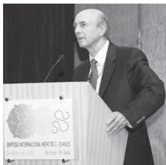
Harvey Alter durante palestra sobre descoberta do vírus da hepatite C

Duas décadas depois da descoberta do vírus, a hepatite C ainda continua fazendo vítimas de forma silenciosa por todo o mundo. Dados da OMS mostram que cerca de 170 milhões de pessoas contraíram o vírus. No Brasil, as principais doenças provocadas por este tipo de hepatite, caso da cirrose hepática e do câncer no fígado, matam em torno de nove mil pessoas por ano. A