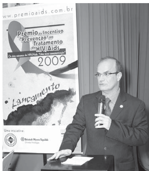
“Tratar da informação e dos aspectos preventivos do HIV/Aids são nossas prioridades”, diz Furtado

prevenção, pois ainda registramos cerca de 7 mil novas notificações de Aids por dia, principalmente no público em questão. Tratar da informação e dos aspectos pre-