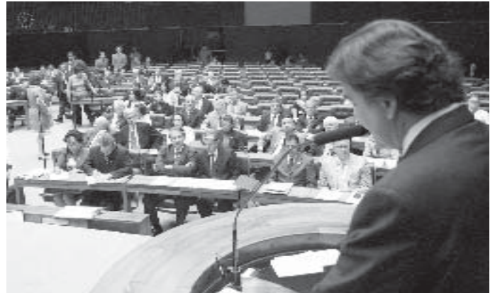
O Ministro da Saúde, José Gomes Temporão, durante reunião que contou com participação da SBI para novo protocolo contra Influenza A

As recomendações da SBI defendiam que os médicos pudessem iniciar o tratamento dos pacientes que, nas primeiras 48 horas, apresentassem febre abrupta, acompanhada de pelo menos um dos seguintes sintomas: tosse, dor de garganta, dor de cabeça e mialgia.